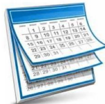
Календарный учебный график